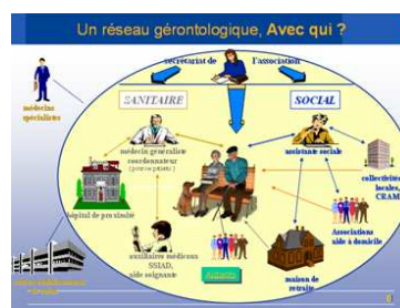
Concept du réseau gérontologique